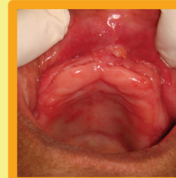
Traumatismos por Prótese