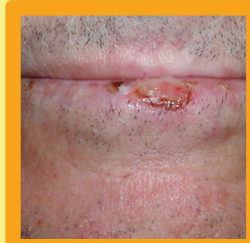
Queimaduras por Sol